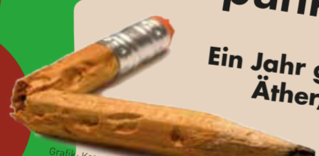
Grafik: Katerina Haller

poetry is komm mit uns, verschwende deine zeit! a punkrocker.